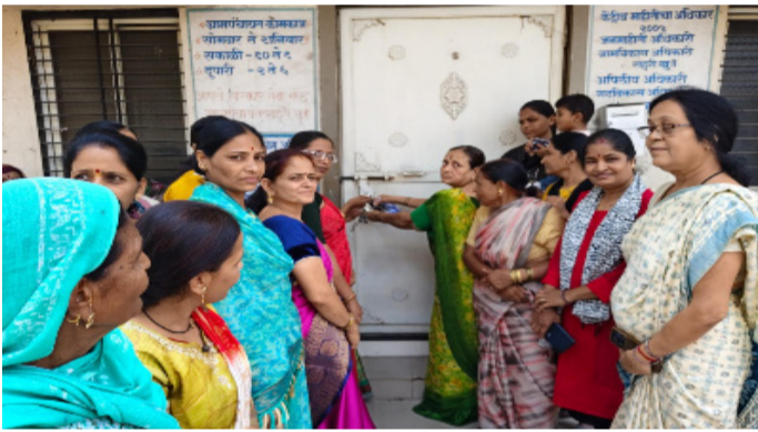
पाणी घा, मगच कुलूप उघडू; राहुरी खुर्दमध्ये महिलांचा इशारा

महिलांनी सांगितले की, आम्ही नियमितपणे व वेळेवर पाणीपट्टी भरत