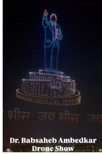
Dr. Babsaheb Ambedkar Drone Show

यावेळी सांस्कृतिक कार्य मंत्री अॅड आशिष शेलार, केंद्रीय सामाजिक