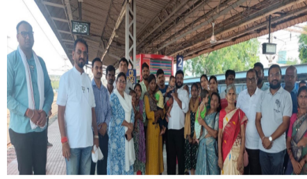
बालकांवरही होणार शस्त्रक्रिया* :

* ५ महिन्यांच्या चिमुकलीसह ६ महिन्यांच्या