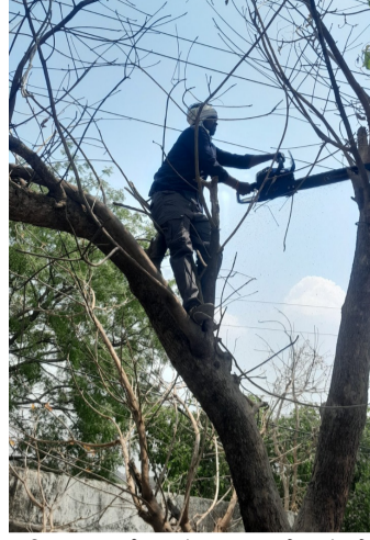
हावितरण कर्मचाऱ्यांच्या मदतीने अंदाजे २७ किलोमीटर विद्युत पुरवठा करणाऱ्या मुख्य लाईन खालील झाडांच्या फांद्या कडूर च्या मदतीने कापण्याच्या कामावर

लाईन खूप जिर्ण झाल्यामुळे या लाईन वरील तारा, ब्रॅकेट, विद्युत रोधक, जीर्ण झाल्यामुळे एखादा वादळी वारा झाल्यास विद्युत पुरवठा तासनतास खंडित होतो. याचा नाहक त्रास नागरिकांना सोसावा लागत आहे यामुळे या मुख्य लाईनच्या दुरुस्तीचे काम करण्याची मागणी दरवर्षी होत असते.