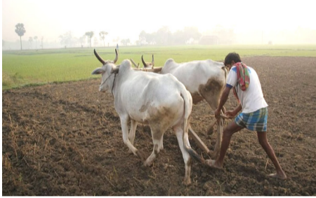
क्षेत्रावर भात लागवडीचे नियोजन करण्यात आले आहे. खत उपलब्धतेबाबत कृषी विभागाने ११,०८८ मेट्रिक टन रासायनिक खतांची मागणी केली असून शासनाकडून जिल्ह्यासाठी ११,५५० मेट्रिक टन खतसाठी मंजूर करण्यात आला आहे. त्यामध्ये युरिया ९,७०० मेट्रिक टन, डीएपी २०० मेट्रिक टन, एमओपी ५० मेट्रिक

अक्षराज : जे. के. पोळ दि.२०, ठाणे : जिल्हा परिषद ठाणेच्या कृषी विभागामार्फत आगामी खरीप हंगामासाठी निविद्या नियोजन करण्यात आले असून आवश्यक निविद्या उपलब्ध करून देण्यासाठी जिल्हा प्रशासन सज्ज झाले आहे. खरीप हंगामाच्या पार्श्वभूमीवर भात व तूर बियाण्यांची मागणी करण्यात आली आहे. तसेच शेतकऱ्यांच्या अडचणी तत्काळ सोडवण्यासाठी जिल्हास्तरीय नियंत्रण कक्ष, तालुकास्तरीय तक्रार निवारण समित्या आणि भारी पथके स्थापन करण्यात आली आहेत. ठाणे जिल्ह्यात खरीप हंगामाखाली सरासरी सुमारे ६०,००० हेक्टर क्षेत्र असून त्यापैकी भात पिकाखालील सरासरी क्षेत्र ५५,००० हेक्टर आहे. मागील वर्षी ५५,१४३ हेक्टर क्षेत्रावर भात पिकाची लागवड करण्यात आली होती. यंदाच्या हंगामातही सुमारे ५५,००० हेक्टर