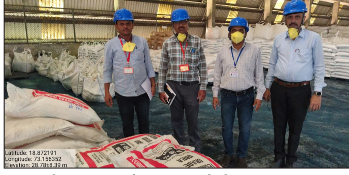
अनुदानित युरियाच्या गैरवापरावर कृषी विभागाची कडक नजर

ही तपासणी मोहीम पुढेही नियमितपणे सुरू राहणार असून, अनधिकृत साठा किंवा गैरवापर आढळल्यास संबंधित कंपन्यांवर रासायनिक खत नियंत्रण आदेश १९८५ तसेच अत्यावश्यक वस्तू अधिनियम १९५५ अंतर्गत कठोर कारवाई करण्यात येणार असल्याचा इशारा प्रशासनाने दिला आहे.