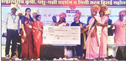
जिल्हास्तरीय कृषी, पशु-पक्षी प्रदर्शन व मिनी सरस हिराई महोत्सव

दि.२४, चिमूर : चंद्रपूर येथील चांदा क्लब ग्राऊंडवर आयोजित 'जिल्हास्तरीय कृषी, पशु-पक्षी प्रदर्शन व मिनी सरस हिराई महोत्सव - २०२६' मध्ये चिमूर तालुक्यातील 'नारीशक्ती महिला प्रभागसंघ, मासळ' यांना तब्बल १ कोटी (१,००,००,०००) रुपयांचा धनादेश सुपूर्द करण्यात आला.