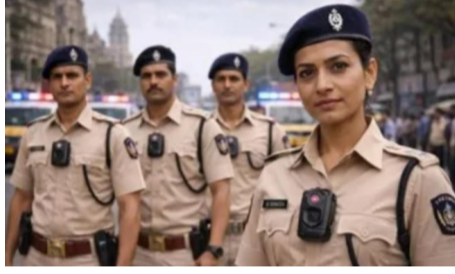
आता पोलिसांच्या प्रत्येक हालचालीवर नजर

इमर्जन्सी कॉलवर सर्वात आधी पोहोचणाऱ्या मुंबई पोलिसांना लवकरच बॉडी-वॉर्न कॅमेरे मिळणार आहेत. पोलिसांच्या गणवेशावर लावले जाणारे हे कॅमेरे त्यांच्या कामकाजाचे थेट रेकॉर्डिंग करणार असून त्यामुळे पोलिसांच्या कार्यप्रणालीत अधिक पारदर्शकता येणार आहे. अमेरिकेसारख्या विकसित देशांमध्ये अशा प्रकारचे बॉडी कॅमेरे वापरले जातात आणि त्याच धर्तीवर महाराष्ट्र पोलिसांमध्येही ही प्रणाली लागू करण्याची तयारी सुरु आहे. यामुळे घटनास्थळी घडणाऱ्या प्रत्येक गोष्टीची नोंद ठेवणे शक्य होणार आहे.