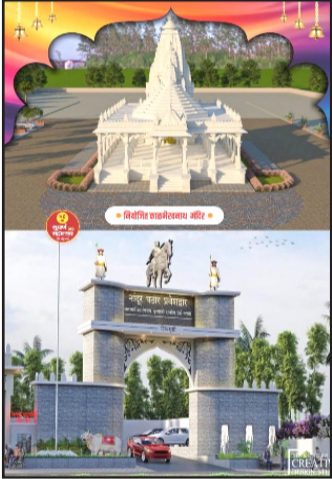
काढण्यात आली होती.

सुवर्ण महोत्सवाचे औचित्य साधून दत्त मंदिर, श्रीराम मंदिर, हनुमान मंदिर व मुक्ताई माता मंदिर मध्ये मूर्ती स्थापना व कलशारोहण समारंभाचे आयोजन करण्यात आले असून गुन्वार, दि. ३० जानेवारी २०२५ रोजी सायंकाळी ५ वाजता कलश व श्री. मुर्तीचे मिरवणूक