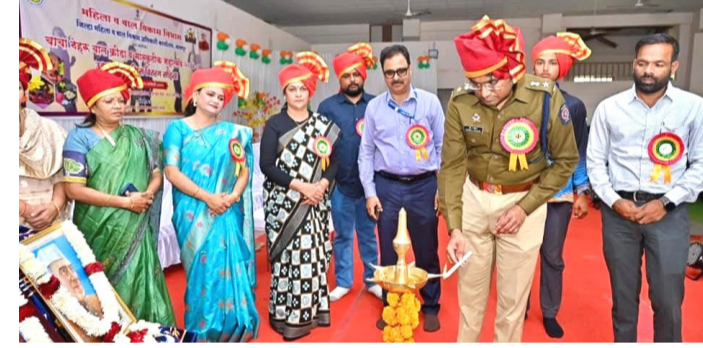
चाचा नेहरू बाल क्रीडा व सांस्कृतिक महोत्सवाचा शुभारंभ

नागपूर ग्रामीण पोलीस मुख्यालय येथे आयोजित चाचा नेहरू बाल क्रीडा व सांस्कृतिक महोत्सवाचे उद्घाटन त्यांच्या हस्ते करण्यात आले. यावेळी महिला व बालविकास विभागाच्या विभागीय