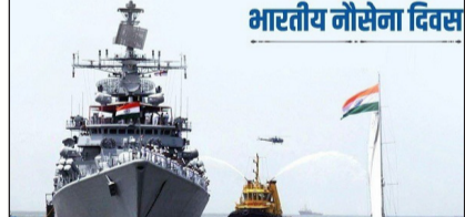
भारतीय नौसेना दिवस

युद्धासाठी नोव्हेंबर पर्यंत थांबावे लागेल. नोव्हेंबर पर्यंत सैन्याची जुळवाजुळव व्यवस्थित करता येईल याची खात्री देण्यासही ते विसरले नाही. खरंतर एप्रिलमध्येच युद्ध व्हावे या मताच्या इंदिरा गांधी होत्या पण लष्करप्रमुखांनी परिस्थिती विषद केल्यानंतर नोव्हेंबर पर्यंत थांबण्याचा निर्णय पंतप्रधान आणि मंत्रिमंडळाने घेतला. त्यामुळे आपण काहीही केले तरी भारत आपल्याला उलट उत्तर देऊ शकणार नाही अशा आविर्भावात पाकिस्तान वावरू लागला. त्यांनी ३ डिसेंबर